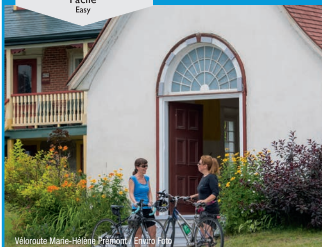
Véloroute Marie-Hélène Prémont